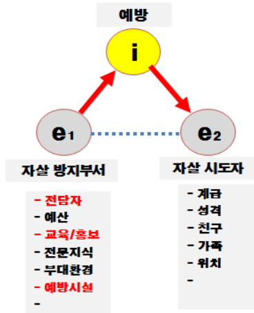
Fig-2. 사람-사람의 요소-상호관계도(1 단계)

자살은 사람과 사람 사이의 문제로 인하여 발생할 가능성이 가장 높다. 이 문제의 핵심은 자살자와 자살을 막아야 하는 사람들의 문제로 볼 수 있다.