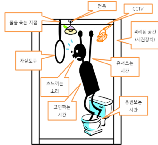
Fig-4. 화장실에서의 자살사고

자살도구, 줄을 묶는 지점, 격리된 공간, 호느끼는 소리, 유서쓰는 시간, 고민하는 시간, 시건장치, 용변보는 시간, CCTV, 화장실 전등, 변기등은 자살상황 당시의 주요 요소들이다.